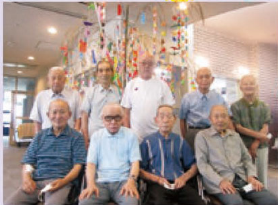
笑顔の素敵な男性方の願いは？