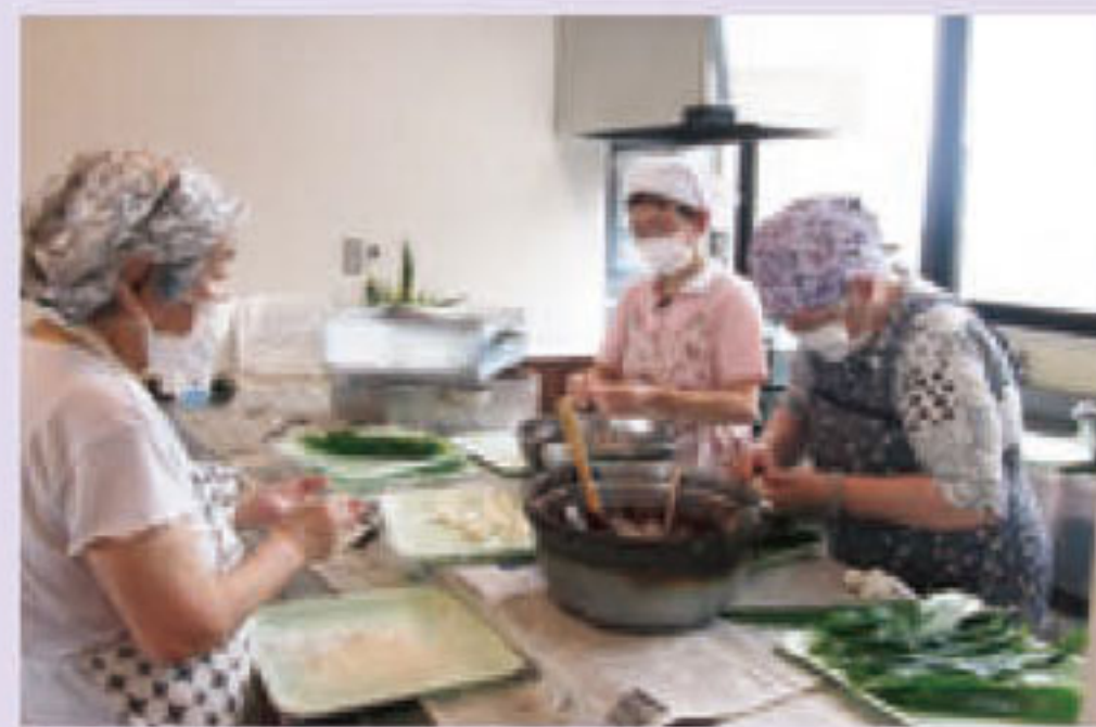
季節のおやつ作り