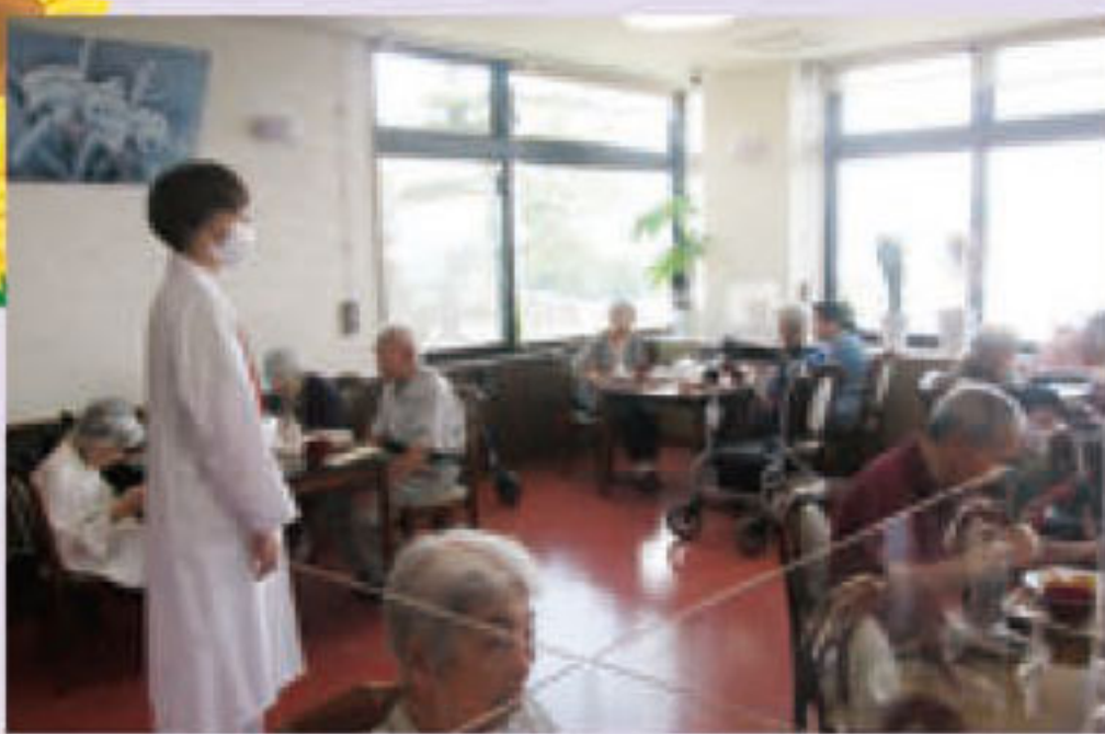
嗜好調査を終えて