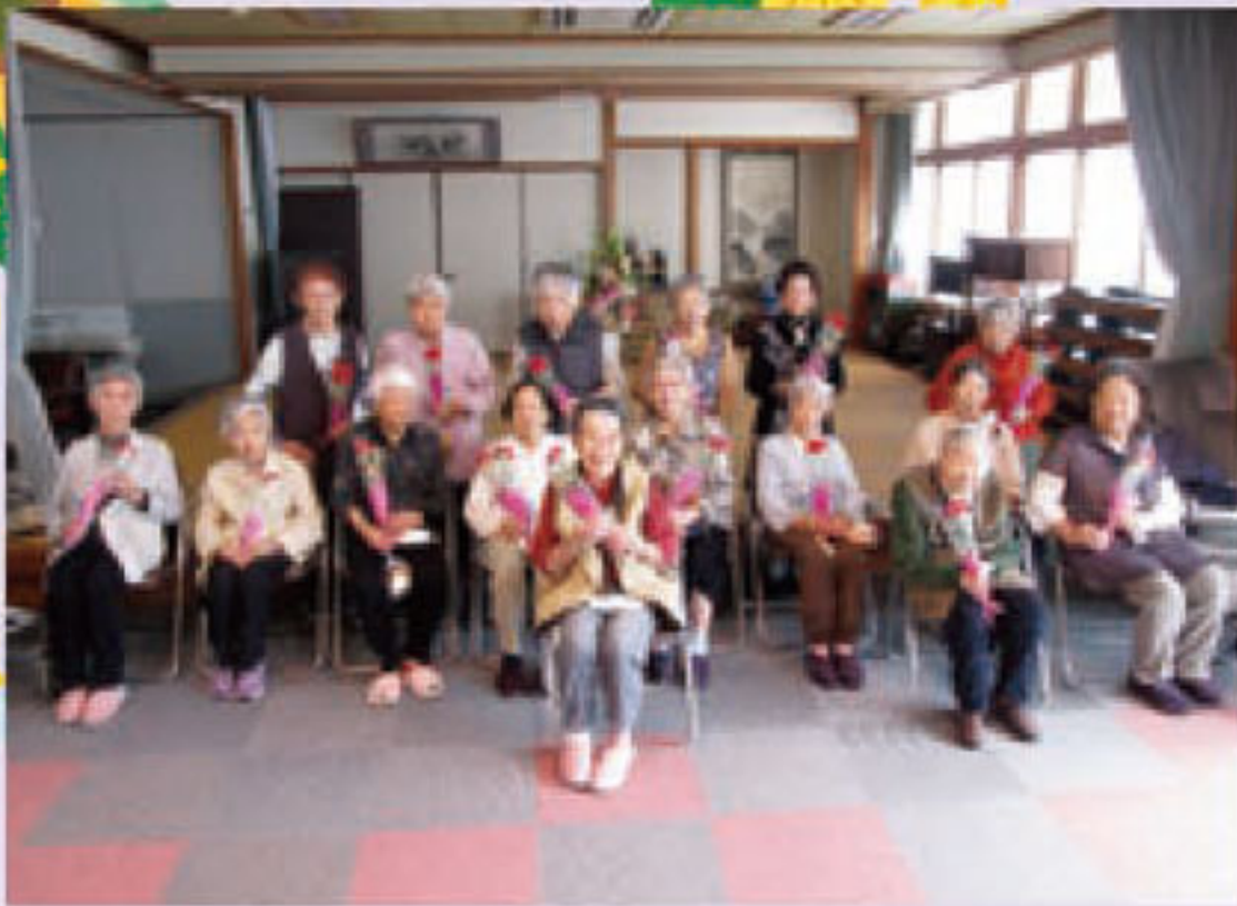
母の日に感謝を込めて花束を