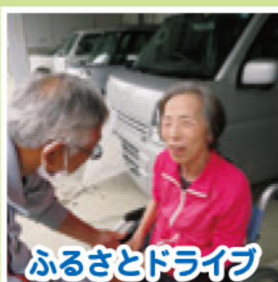
ふるさとドライブ